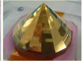
高精度多角形ミラー