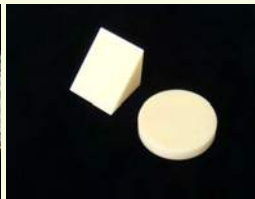
セラミックなどの脆性材料