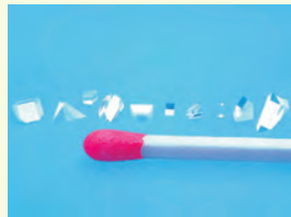
様々な形状の微小プリズム