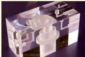
ネジ、ザグリ、中グリ 穴あけ、研磨