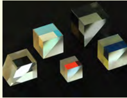
ビームスプリッタ RTIR プリズム