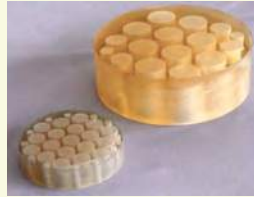
低膨張軽量化平面基板